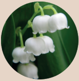
Lirio del Valle